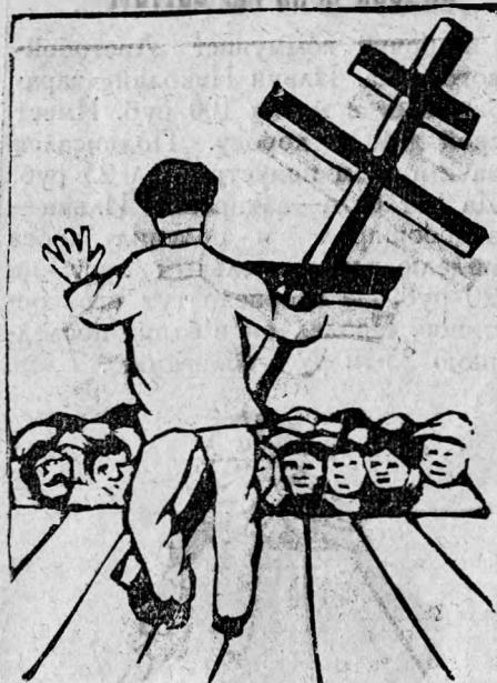
„Вношу предложение: Угробить соревнование и поставить на могилу сей крест“.

Закатчики в Ведерном цехе действительно поняли задачи соревнования и приводят их в исполнение. Они не только повысили производительность, но проверяют друг у друга качество изделий. Это надо считать одним из достижений в соревновании.